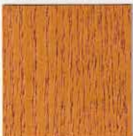
Chêne doré 165