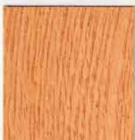
Chêne naturel 025