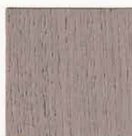
Bois grisé clair 077