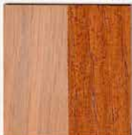
brut application Essence Chêne