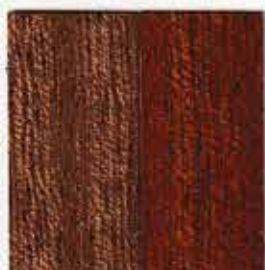
brut application Essence Acajou

La richesse du bois vient de ses multiples essences et de leurs particularités. Il faut en tenir compte lors de la préparation du support et du choix de la teinte.