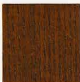
Chêne moyen 184