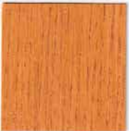
TOLL'AZUR SOLVANT FLUIDE