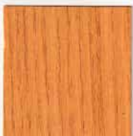
TOLL'AZUR SOLVANT GEL