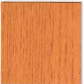
TOLL'AZUR ACRYL SATIN

Pour protéger efficacement le bois, tout en le laissant exprimer sa vraie nature, sa noblesse, sa beauté, sa chaleur, TOLLENS a élaboré la gamme TOLL'AZUR, une gamme complète de lasures de haute technicité composée de produits performants et faciles d'emploi. Microporeuses, souples, hydrofuges et dotées d'un agent de protection du film préventif contre les algues et les champignons, elles laissent respirer le bois et le préservent durablement de l'humidité, des moisissures, des variations de températures et du grisaillement grâce à son action anti-UV.