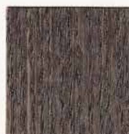
Bois grisé 068