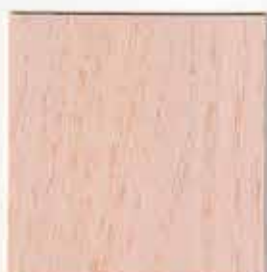
Chêne blanchi 041