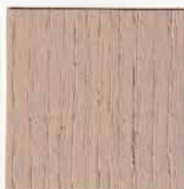
chêne cèrusé 054