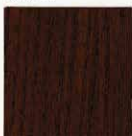
Chêne rustique 168