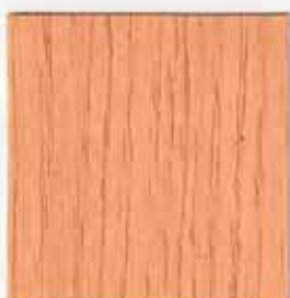
Bois clair 035