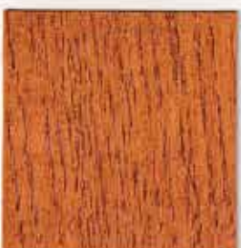
Pin d'Orégon 172