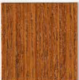
Chêne clair 021