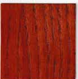
Acajou foncé 169